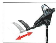
腕の長さによってグリップの位置を調整できます。